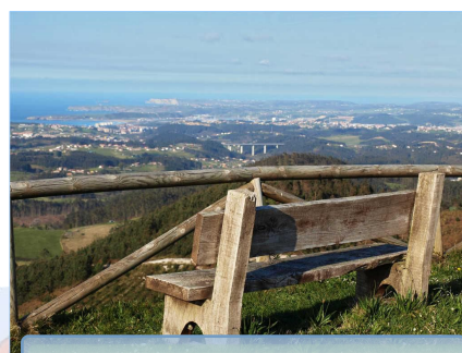
Mirador de Pulide

La siesta larga está garantizada totalmente (salvo lluvia claro).