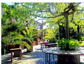
Jardines de La Peñuca, Gijón