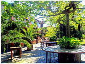
Jardines de La Peñuca, Gijón