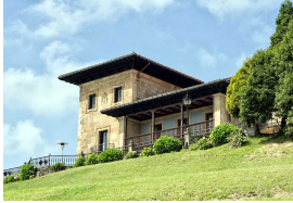
Palacio de La Riega, Gijón