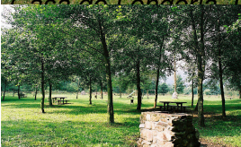
Casa de Lencopio