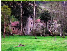
Palacio de Dóriga, Salas, Asturias