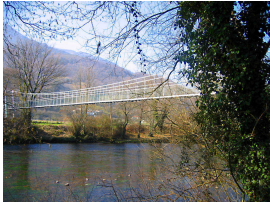
Pasarela sobre el Nalón entre Coto Villanueva y Las Mestas, Salas, Asturias

Al llegar al alto, iniciaremos un divertido descenso y nos dirigimos a Dóriga, donde nos encontraremos con el Palacete del mismo nombre y un agradable bar para reponer fuerzas, "Ca Pacita".