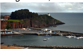
Puerto de Candás (desde mirador de La Formiga)