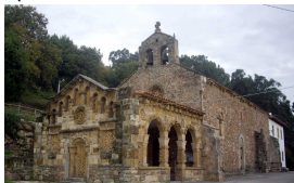
Iglesia Santa María La Real, Logrezana, Asturias