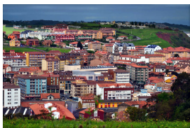
Candás (desde mirador de La Formiga)