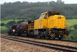
Tren torpedo Arcelor F-8