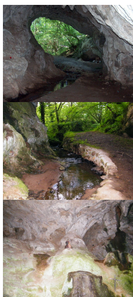
Cueva de San Pedrín, Narzana.

Cruzaremos toda la vega y nos acercaremos a la coquetuela cueva de San Pedrín, objeto central de ésta ruta. El acceso a la cueva es sencillo... sólo hay que caminar/pedalear unos 300 mts.