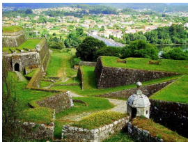
Valença do Miño