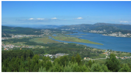
Desembocadura do Miño, desde o monte de Santa Tegra, A Guarda, Galiza

La Groba. Visitaremos el Monasterio de Santa María de Oia (no tiene visita guiada) que cuenta con elementos góticos, románicos y Barrocos y jugó un importante papel en la defensa de la costa.