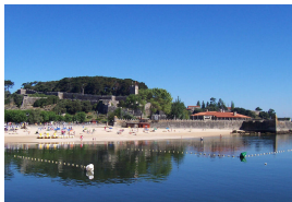
Praia da Ribeira, Baiona, Galiza

Por la tarde iremos rumbo hacia La Guardia, por carretera comarcales, sin tráfico, siguiendo por momentos la Ruta do Viño y cruzaremos 2 veces la carretera general. Luego tomaremos la Senda de los Pescadores, y a continuación la senda de la desembocadura del Miño, donde podremos disfrutar de esta pequeña “Doñana gallega”, totalmente pegada al río, y luego al mar y tal como dice su nombre llegaremos justo a la desembocadura, donde nos daremos un gustoso baño en sus aguas. Todo por pista sin dificultad, algún tramo de arena que habrá que bajarse pero sin complicación.