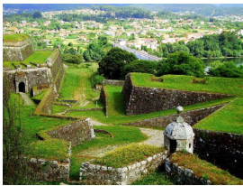
Valença do Miño