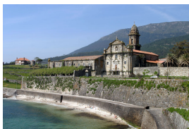
Monasterio de Santa María de Oia, Galiza

Saldremos de Asturias hacia el mediodía para llegar a Sabarís, al lado de Baiona y aparcar los coches en dicha localidad. Una vez allí, cogeremos las bicis y pedalearemos 15 kms por carril-bici hasta el albergue, que está en Mougás. Dependiendo de la hora podremos disfrutar de una espectacular puesta de sol mientras vamos pedaleando.