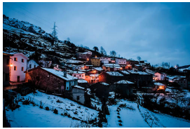
Riospaso, Asturias

Publicado por Cicloturismo - 03 Ago 2013 23:54