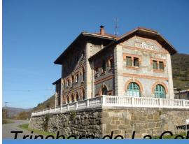
Trinchera de La Cebertoria