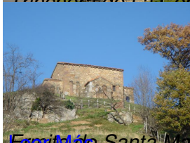
Ermita de Santa María de Lena