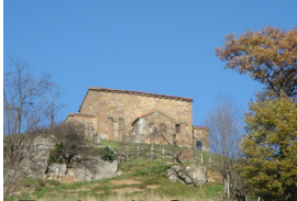
Ermita de Santa María de Lena