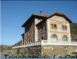
Trinchera de La Cebertoria

Campomanes, según la historia, la iglesia de Santa María de Huerna de Oviedo, los