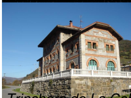
Trinchera de La Cebertoria