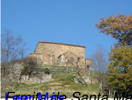
Ermita de Santa María de Lena