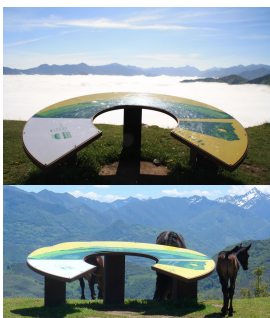
Mirador del Cotobello, Aller

El paraje de Cotobello fue una de las explotaciones mineras a cielo abierto de Hunosa, situada entre la sierra de Conforos, el Cordal de Murias y Santibañez. Tras terminar esas extracciones de mineral se procedió a la restauración medioambiental o transformación natural del paisaje, para destinarlos a usos ganaderos o turísticos.