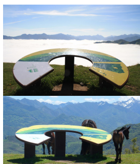
Mirador del Cotobello, Aller

El paraje de Cotobello fue una de las explotaciones mineras a cielo abierto de Hunosa, situada entre la sierra de Conforos, el Cordal de Murias y Santibañez. Tras terminar esas extracciones de mineral se procedió a la restauración medioambiental o transformación natural del paisaje, para destinarlos a usos ganaderos o turísticos.