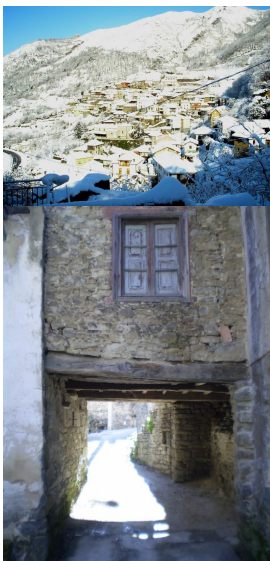
Murias de Aller

No entra en esta salida, pero cabe destacar una cascada sobre el río Xurbeo muy bonita que hay cercana a Santibañez y que, recomendamos visitar cuando tengais más tiempo