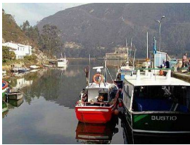
Puerto pesquero, Bustio

. El Cementerio de Vidiago será el último contacto con esta aldea.