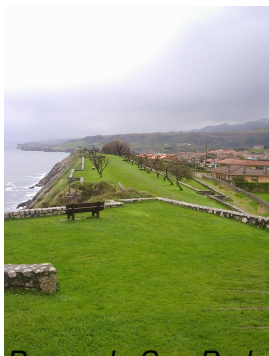
Paseo de San Pedro, Llanes