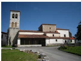
Iglesia de San Acislo, Pendueles

La entrada al pueblo de Pendueles se hace desde la N-634; allí nos encontramos con la iglesia de San Acislo , cuya portada gótica nos sirve de referencia para continuar el camino 100 m después: el nuevo trayecto costero tiene entre 250 y 3 metros de ancho y enlaza a su vez con la ya existente AS/GRP19 procedente de Bustio.