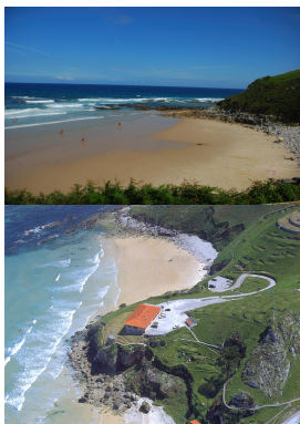
Playa de Vidiago

La entrada al pueblo de Pendueles se hace desde la N-634; allí nos encontramos con la iglesia de San Acislo , cuya portada gótica nos sirve de referencia para continuar el camino 100 m después: el nuevo trayecto costero tiene entre 250 y 3 metros de ancho y enlaza a su vez con la ya existente AS/GRP19 procedente de Bustio.