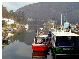
Puerto pesquero, Bustio

. El Cementerio de Vidiago será el último contacto con esta aldea.