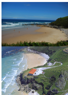
Playa de Vidiago

La entrada al pueblo de Pendueles se hace desde la N-634; allí nos encontramos con la iglesia de San Acislo , cuya portada gótica nos sirve de referencia para continuar el camino 100 m después: el nuevo trayecto costero tiene entre 250 y 3 metros de ancho y enlaza a su vez con la ya existente AS/GRP19 procedente de Bustio.