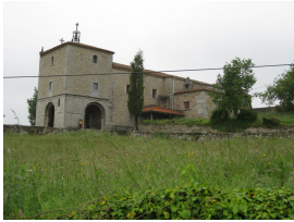
Santuario de Nuestra Señora del Fresno, Grado

Hacia el año 830 el rey astur Alfonso II acudió a donde se creía haber encontrado los restos del apóstol Santiago. Ordenó la construcción de un templo en aquel lugar y dio cuenta del suceso a Carlomagno, y la noticia se propagó entonces con rapidez por toda Europa. Así parece que nació el Camino de Santiago. De este primitivo camino, de San Salvador en Oviedo a Compostela, vamos a hacer una adaptación para bicicleta de la primera etapa, entre Oviedo y Grado.