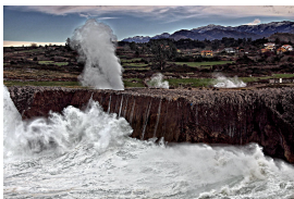
Bufones de Pría, Llanes

En el Parque de Garaña cogemos el P.R.AS-57 (perteneciente a la Senda Costera G.R. E-9), senda preciosa donde las haya que une las playas de Guadalmía, Villanueva, Cuevas del Mar, San Antonio y San Antolín. Aquí comienza, sin duda, la parte más hermosa de la ruta. El único inconveniente es que en este tramo sí que hay continuas subidas y bajadas, coincidiendo con cada una de las playas. El recorrido oficial llega hasta la playa de Cuevas del Mar, para llegar a la cual tenemos que pasar de nuevo por una pequeña Cueva que da acceso a ladicha playa.