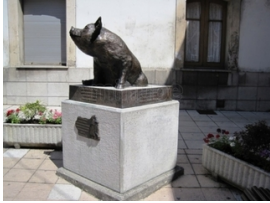
El gochín de Noreña

** ¡¡Recomendada para menores y ciclistas noveles!!