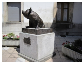
El gochín de Noreña

** ¡¡Recomendada para menores y ciclistas noveles!!