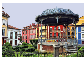
Quiosco de la Música, Noreña

Esta ruta no va por la carretera del alto de La Madera, sino por una carretera paralela mucho más fácil y bonita de pedalear.