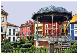
Quiosco de la Música, Noreña

Esta ruta no va por la carretera del alto de La Madera, sino por una carretera paralela mucho más fácil y bonita de pedalear.