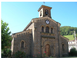
Iglesia de Santa Eulalia, Ujo