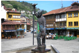
Plaza de Requejo, Mieres

1. Estación de RENFE de Campomanes. Tomamos a la izquierda la calle que baja de la estación hacia Campomanes. A unos 50 metros a la derecha, tomamos la desviación que nos lleva directamente a la senda que transcurre junto al río. Muy bien asfaltado los primeros 1,5 km y pista sin problemas el resto. Una pequeña subida a 1 km y suave descenso hasta el cruce con la carretera LE-4.