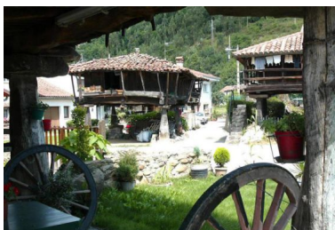
Horreos en Güeñu/Bueño

Los Afilorios se construyó para abastecer de agua potable las poblaciones de la zona central de Asturias, principalmente Oviedo. Se sitúa en el concejo de Ribera de Arriba, si bien, la casi totalidad del embalse se encuentra en el concejo de Morcín.