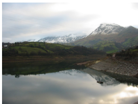
Embalse de Los Alfilorios y Mostayal

Esta es una ruta para ir al embalse de Los Alfilorios, por carretas con poco tráfico. El ascenso al embalse son 4 km de subida constante y algo duro, pero estando de andar un poco, no hay problema. En el embalse hay un pequeño área con mesas y bancos.