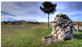
Área recreativa de La Camperona

Tranquilos que sobra tiempo y se espera por todo el mundo . Ya llegados arriba (donde la parada del bus) un poco metido a la izquierda de la carretera por la que subimos hay bar. ESTE será el punto de concentración para esperarnos todos/as tomando algo y picando.