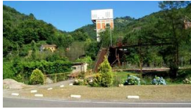
Castillete del Pozo Mosquil

Publicado por Cicloturismo - 10 Mar 2013 13:41