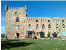
Torre Valdés (San Cucao de Llanera)

Partimos de Lugo de Llanera y, entre amplias praderas, caserías y modernas e intrusas urbanizaciones y similares, pedaleamos, pasando por San Cucao y su castillo o Casa de la Torre, subimos el alto de Santa Cruz y bajamos, ya por el concejo de Las Regueras, hasta el histórico puente de Peñaflores, cruzando el río Nalón y entrando en Grado por el CdS, la Puebla de Grado que saqueó e incendió Gonzalo de Peláez, Conde de Coalla, en el siglo XII.