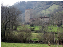
Torre Valdés (San Cucao de Llanera)

Siguiendo el curso del río Cubia, llegamos al castillo de Coalla, cercano a curiosos hórreos con buhardilla, junto al río Las Varas, en un lugar que invita a quedarse a descansar y a contemplar el plácido paisaje. Comeremos en la Sidrería El Tiro en el pueblo de Alcubiella, nos dejan comer el bocata. Después volveremos a Grado y seguiremos trayecto hasta Trubia subiendo el Alto del Fuego.