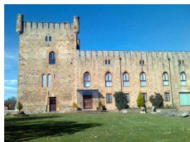
Torre Valdés (San Cucao de Llanera)

Partimos de Lugo de Llanera y, entre amplias praderas, caserías y modernas e intrusas urbanizaciones y similares, pedaleamos, pasando por San Cucao y su castillo o Casa de la Torre, subimos el alto de Santa Cruz y bajamos, ya por el concejo de Las Regueras, hasta el histórico puente de Peñaflores, cruzando el río Nalón y entrando en Grado por el CdS, la Puebla de Grado que saqueó e incendió Gonzalo de Peláez, Conde de Coalla, en el siglo XII.