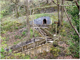
El Mechero de Saús

** Este tema discute el contenido del artículo: El mechero de Saus (12-9-10) **