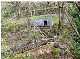
El Mechero de Saús

** Este tema discute el contenido del artículo: El mechero de Saus (12-9-10) **