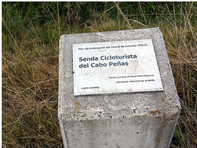
Senda cicloturista Luanco - Cabo Peñas

Publicado por Cicloturismo - 09 Jul 2023 06:40