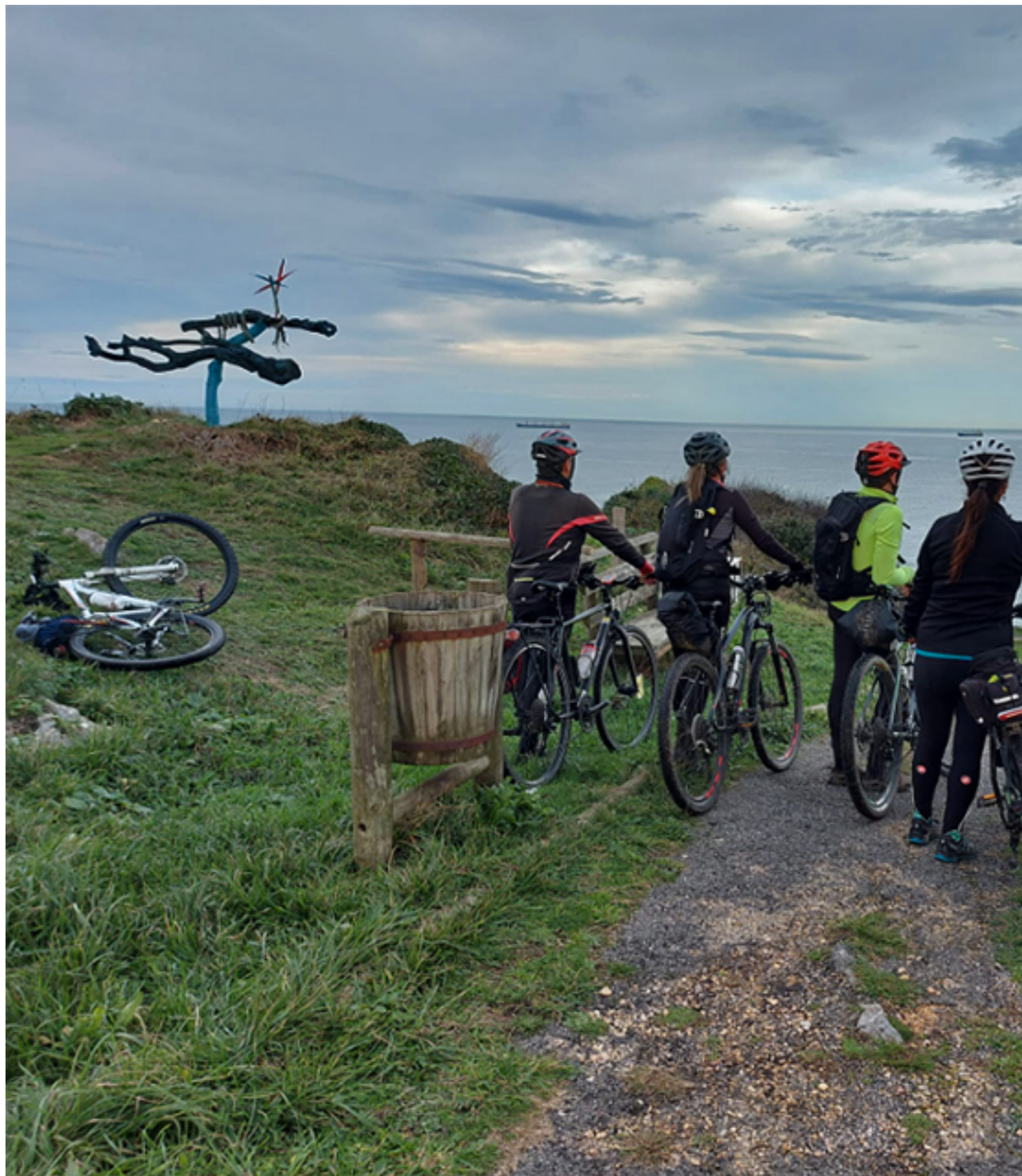
Contemplando el Mar Cantábrico desde la Senda Costera

Publicado por acb_web - 05 Mar 2023 10:00