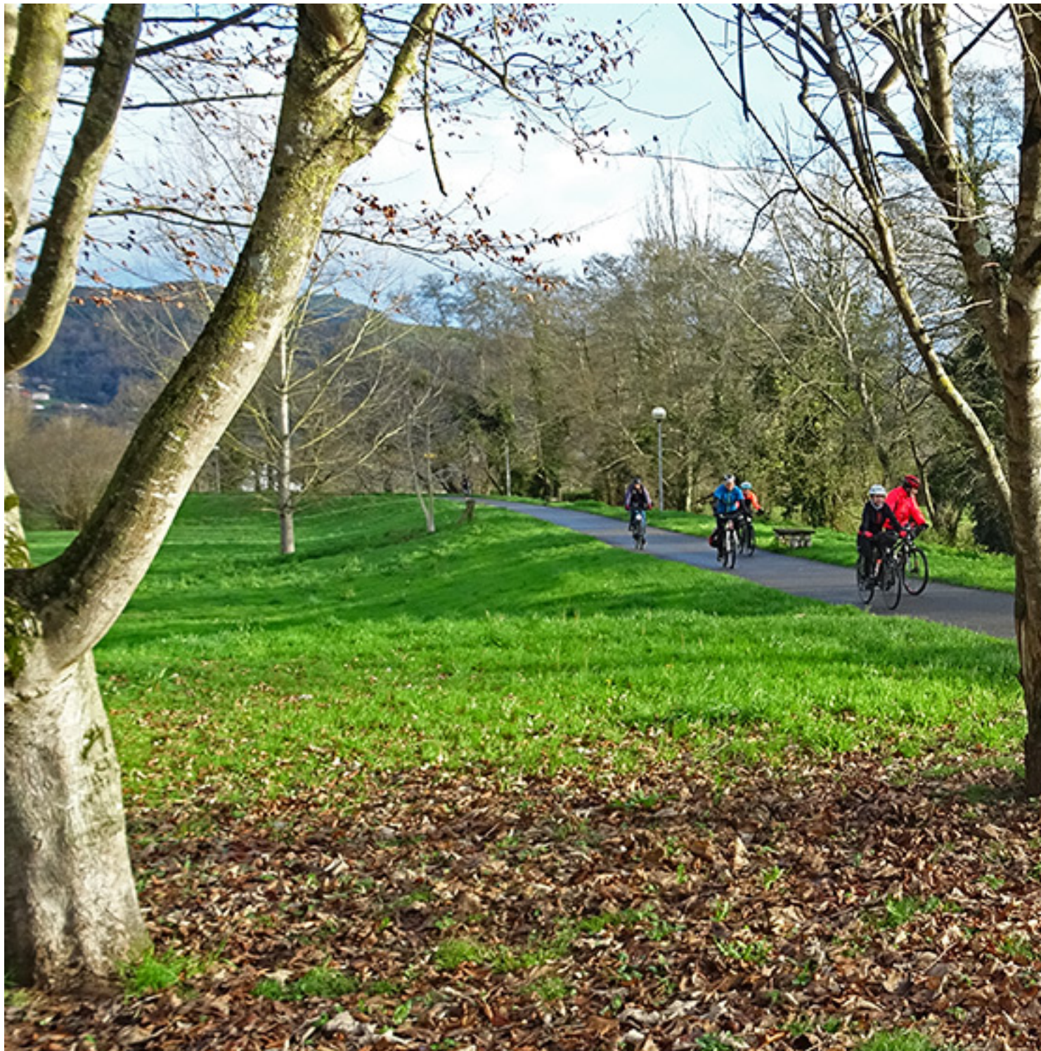
Pedaleando por el paseo del río Cubia

Publicado por Cicloturismo - 25 Sep 2022 11:00