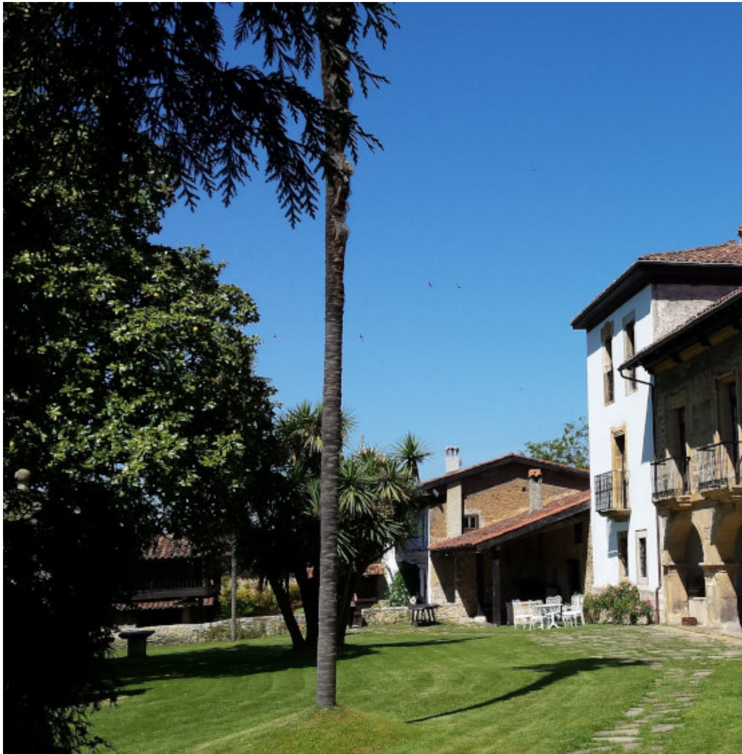
Palacio de Meres

** ¡¡Recomendada para menores y ciclistas noveles!!