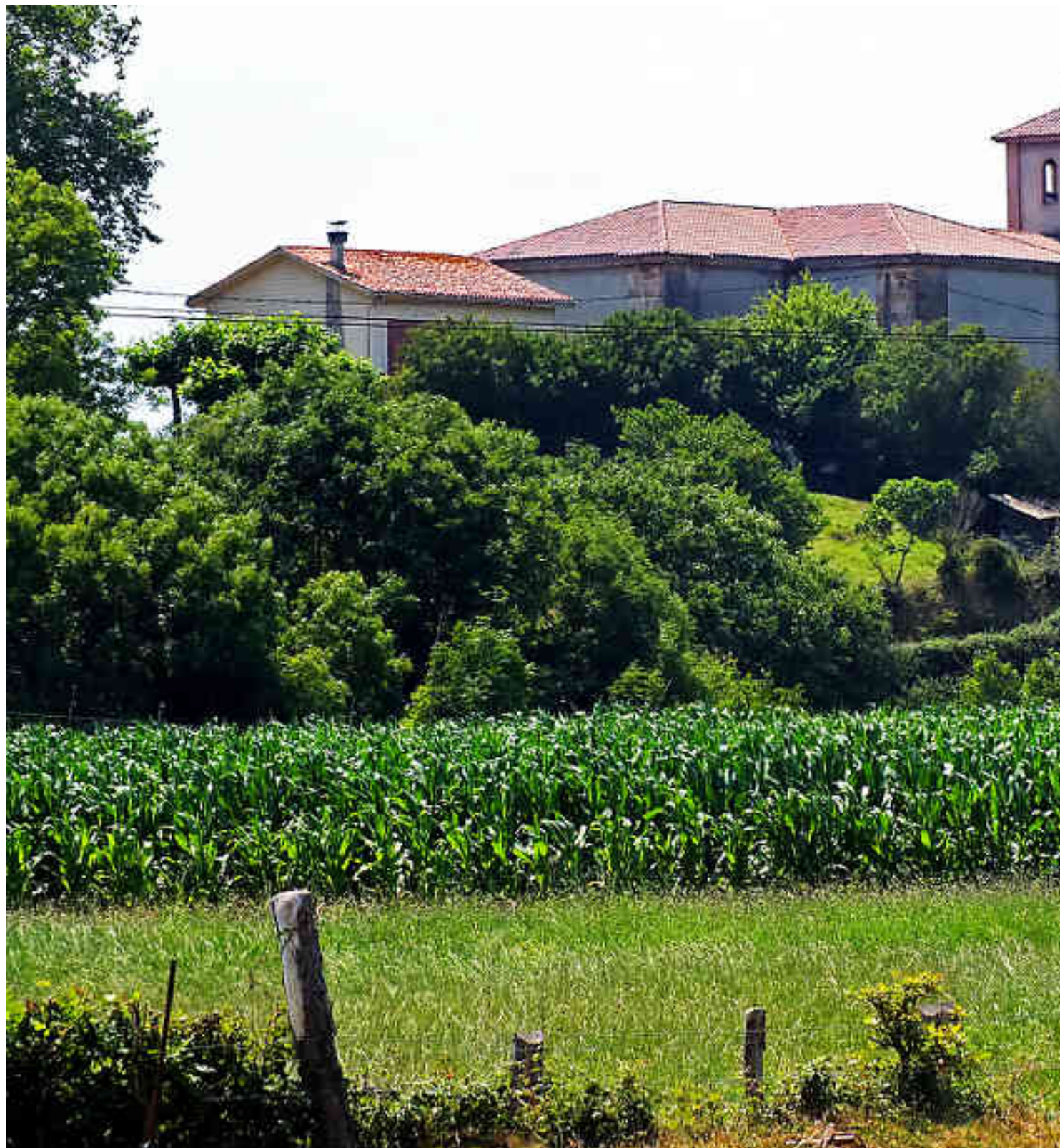
Iglesia de Nuestra Señora de El Remediu

Publicado por Cicloturismo - 03 Jul 2021 08:12