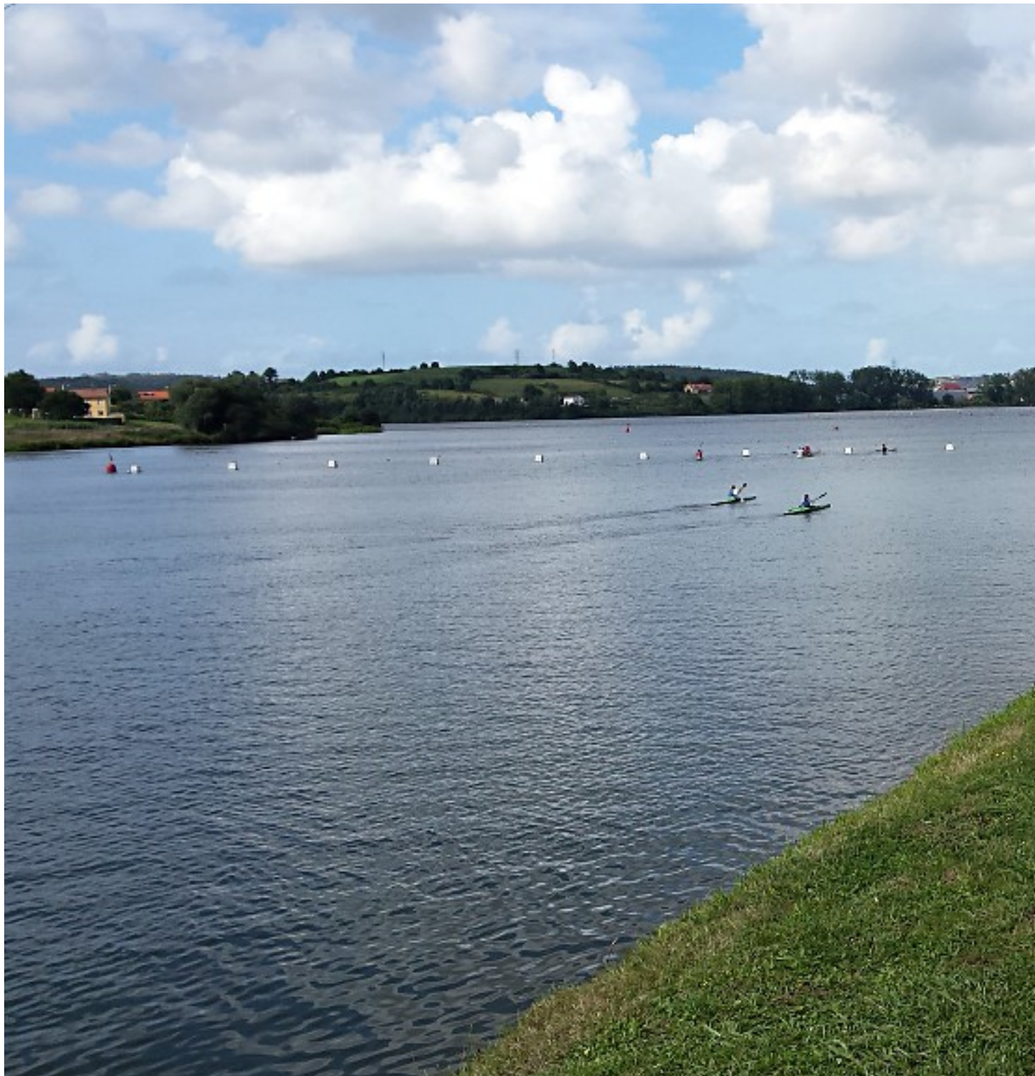
Embalse de Trasona