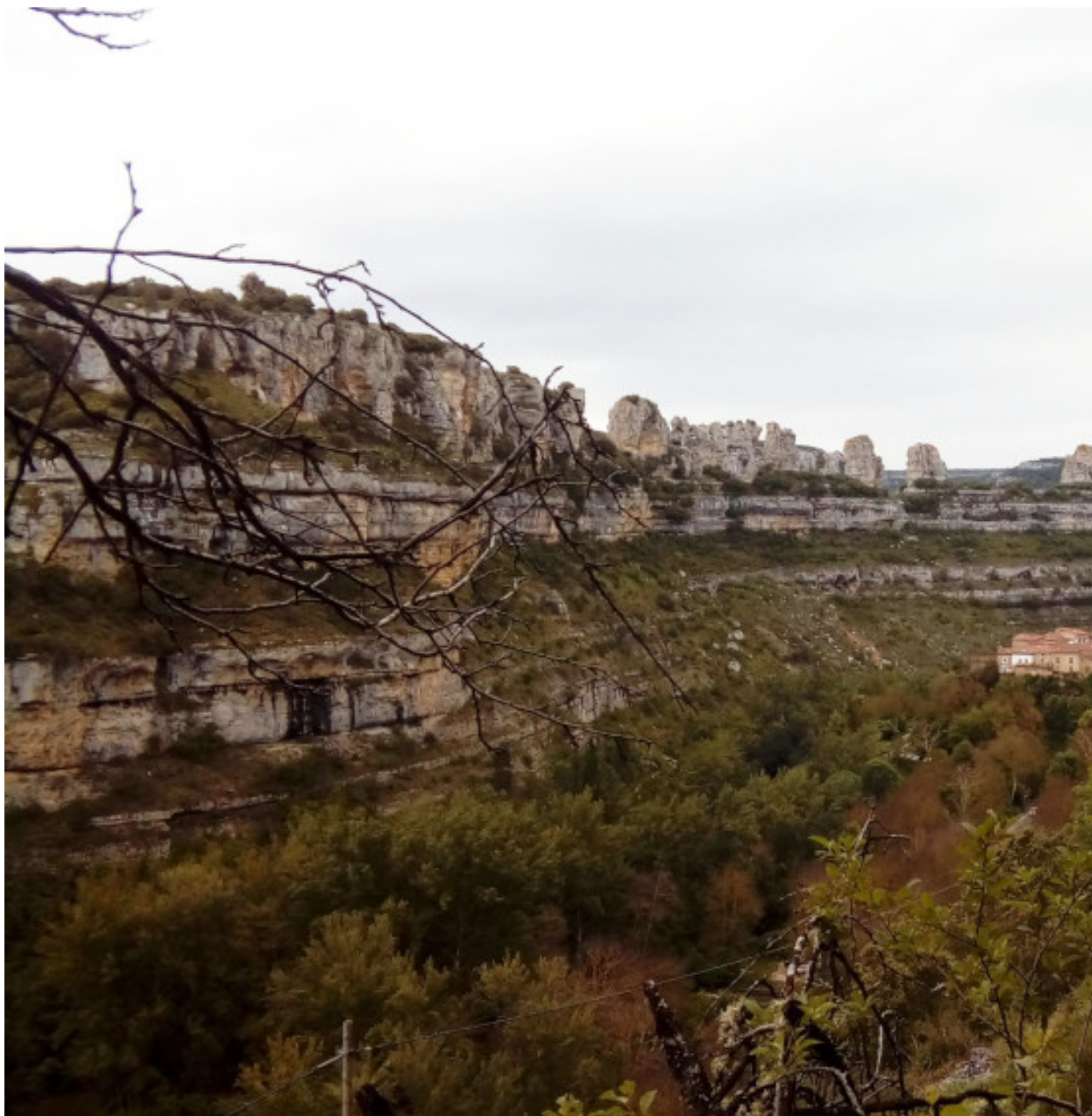
Orbaneja en la garganta del Ebro

Publicado por Cicloturismo - 08 Abr 2019 17:33