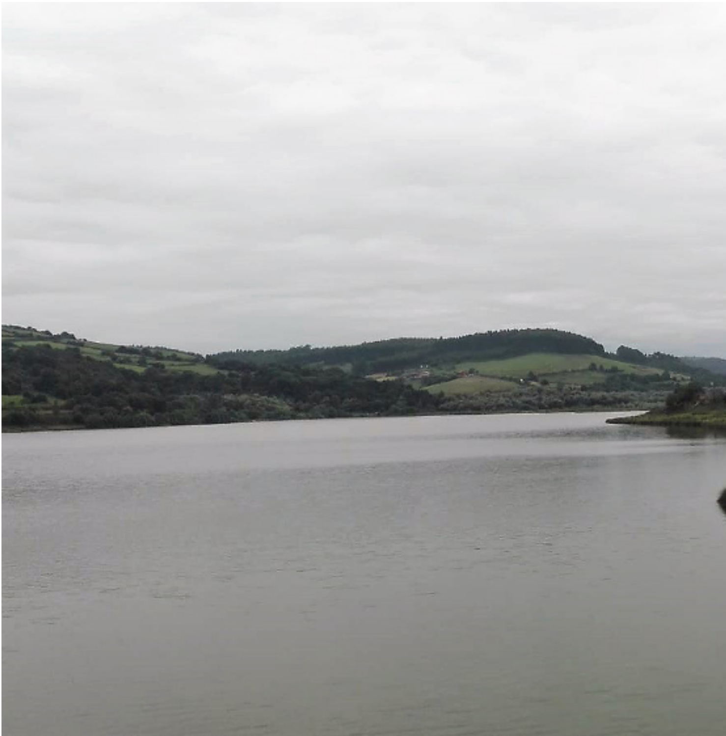
San Andrés de los Tacones