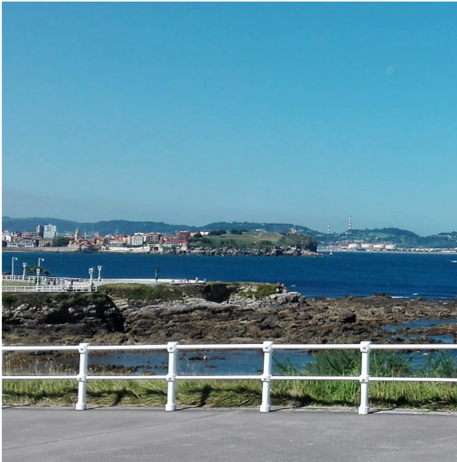
Pedaleando por la costa

Publicado por Cicloturismo - 20 Oct 2018 00:00