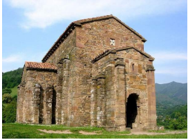
Santa Cristina de Lena