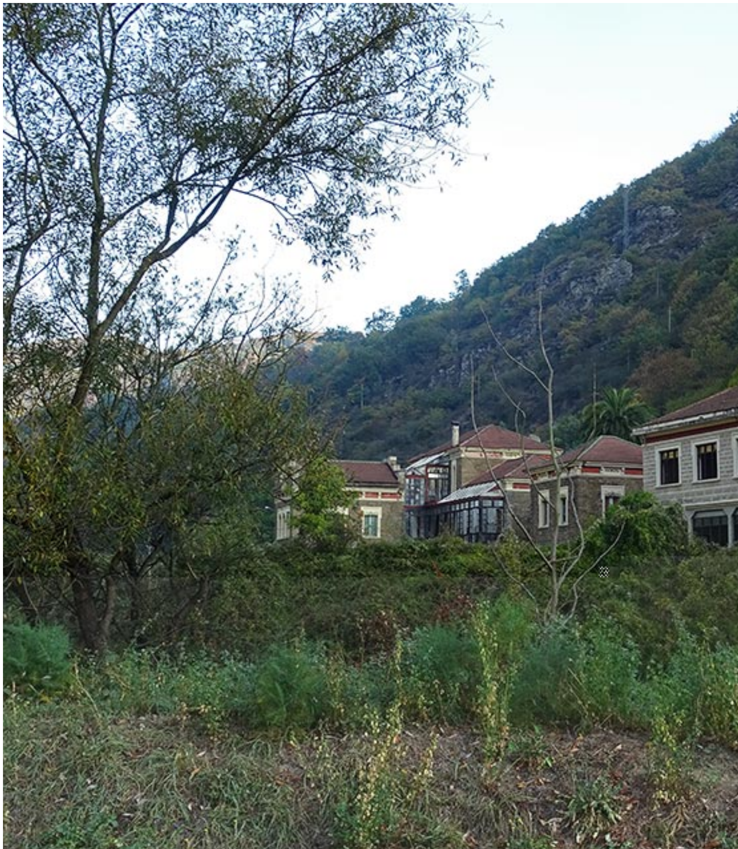
Abandonado hospital minero de Bustiello