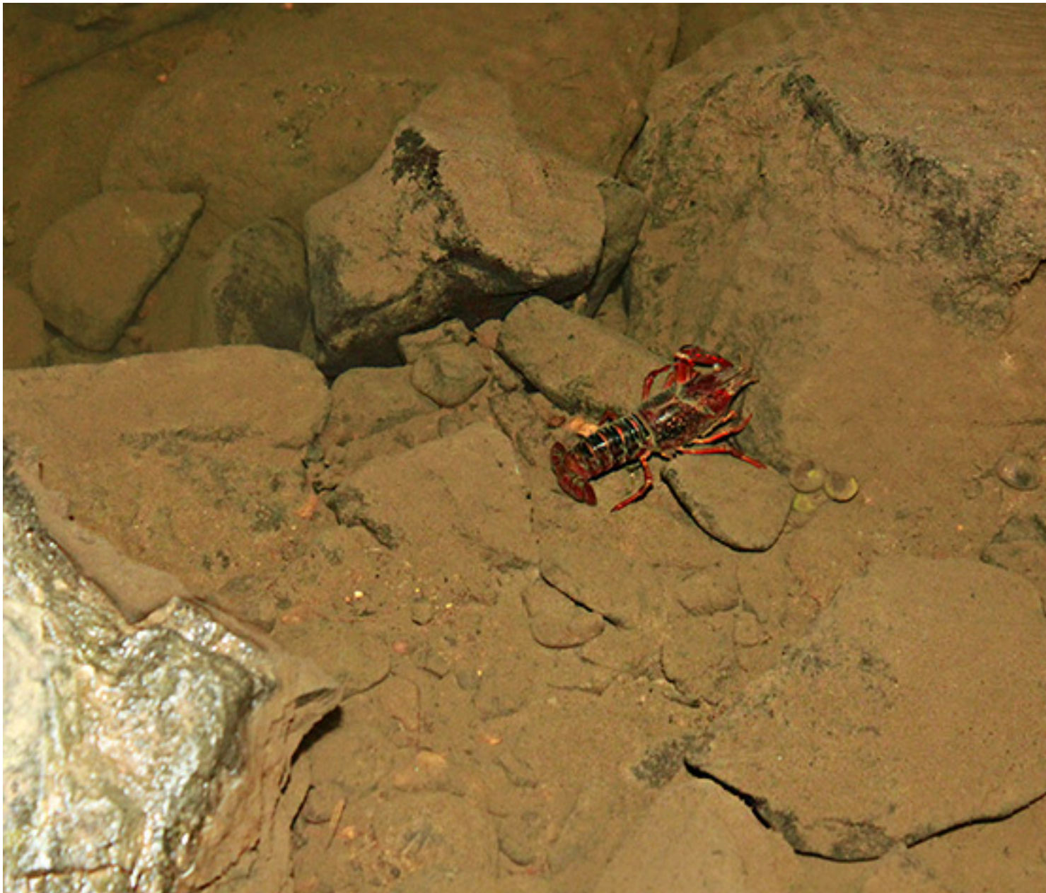
Cangrejo de río