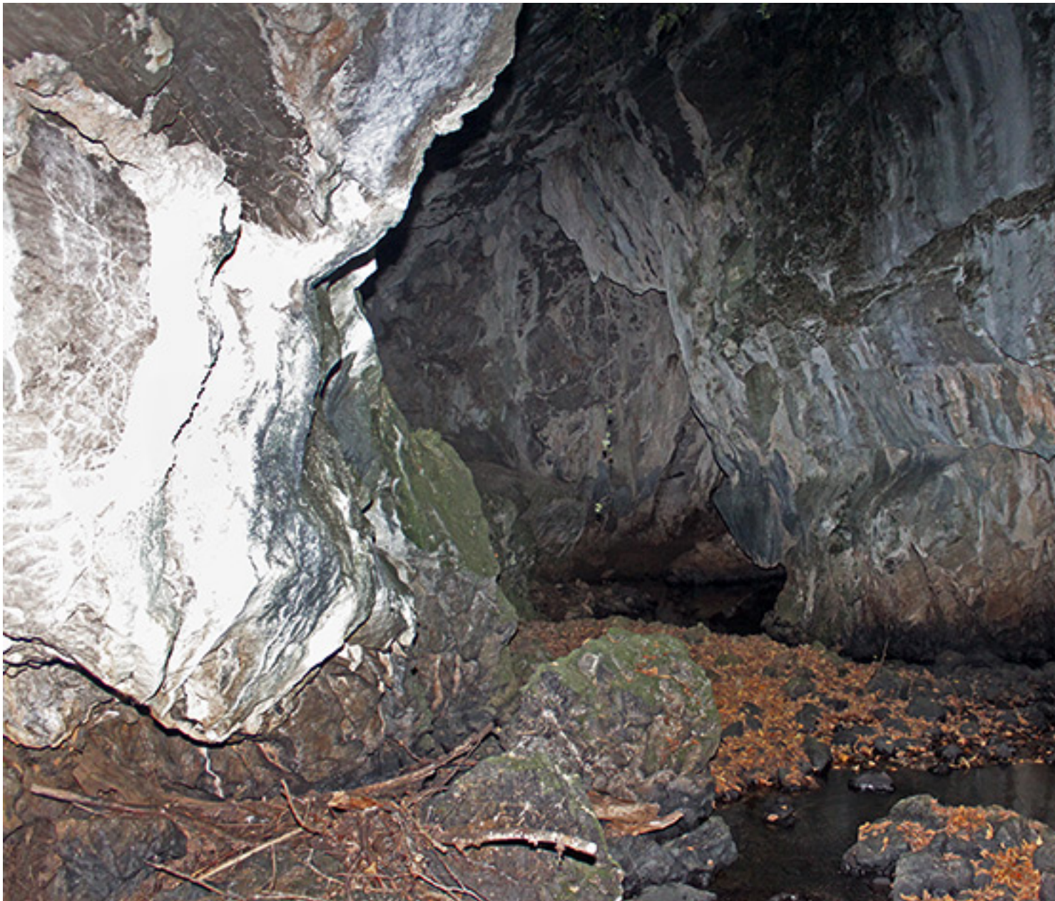
Cueva del rio...???