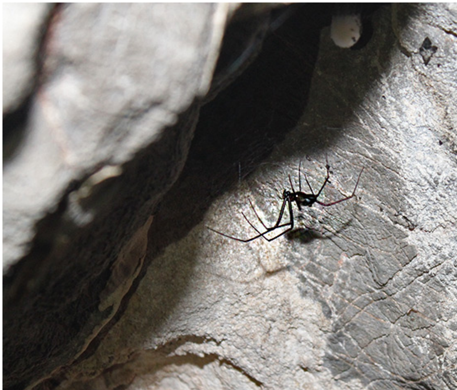
Ésta también está en su casa