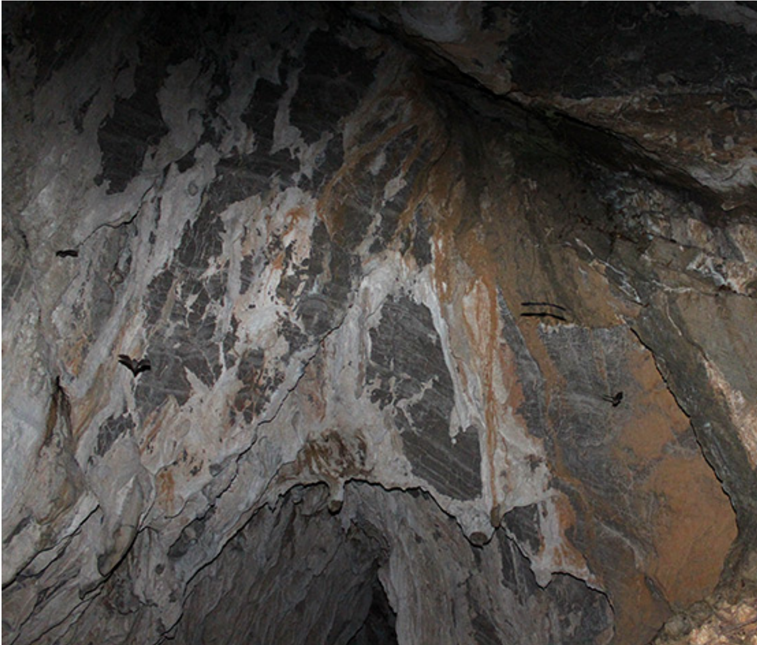
Los legítimos moradores

Tras la visita, seguimos la marcha y al poco llegamos a Brañes donde haremos parada para comer en El Fondín , previamente podemos reservar algo de comer y entre otros manjares, degustar sus exquisitos bocatas de carne guisada.