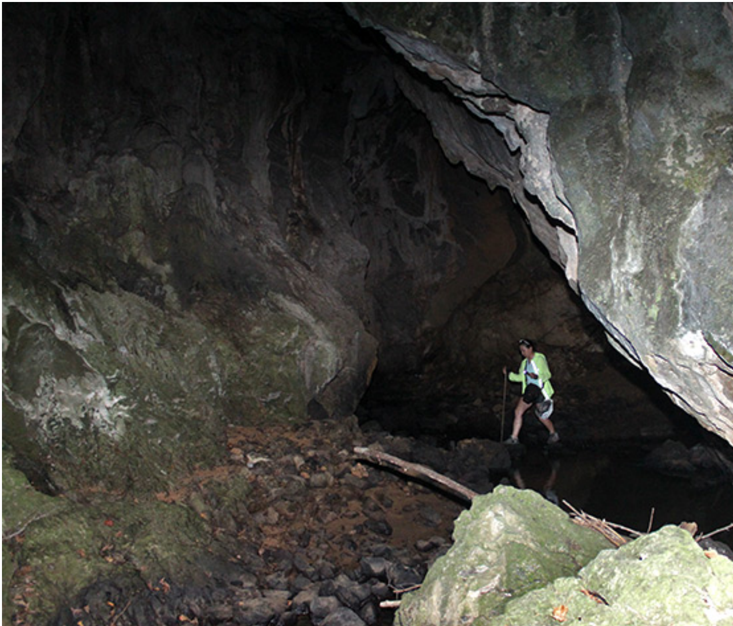
Ella no mora, mira