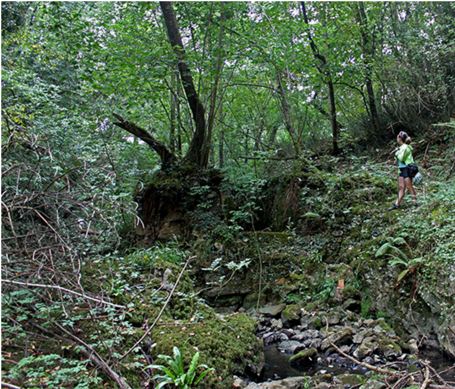
Naturaleza en estado natural