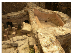
Termas romanas de Santa Eulalia de Valduno