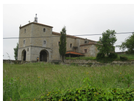
Santuario de Nuestra Señora del Fresno, Grado