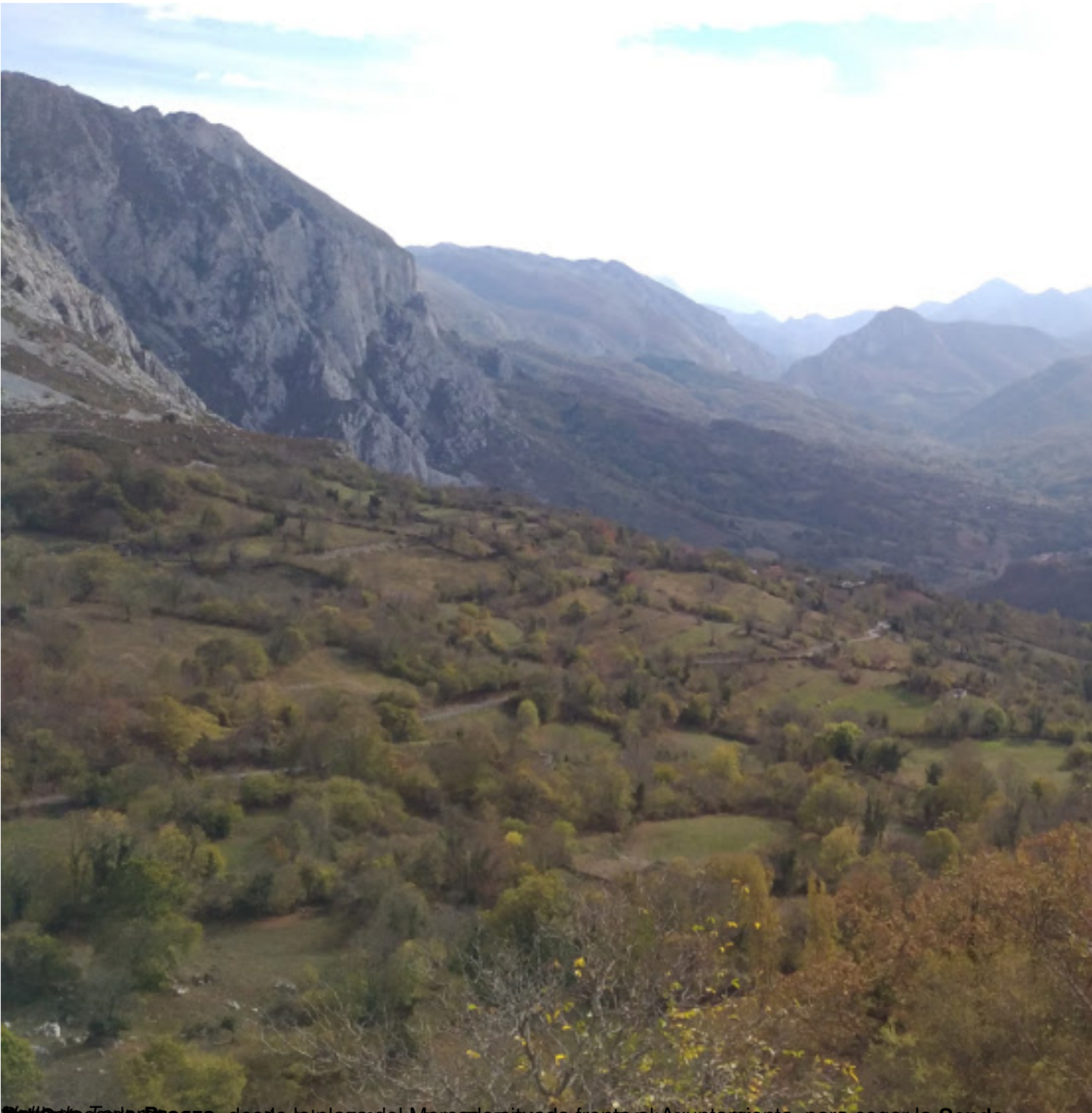
El Valle de Tordesillas, desde la plaza del Mercado situada frente al Ayuntamiento, para coar la Senda de los Pirineos, que comienza en el Ayuntamiento y se dirige hacia el norte, rampa de