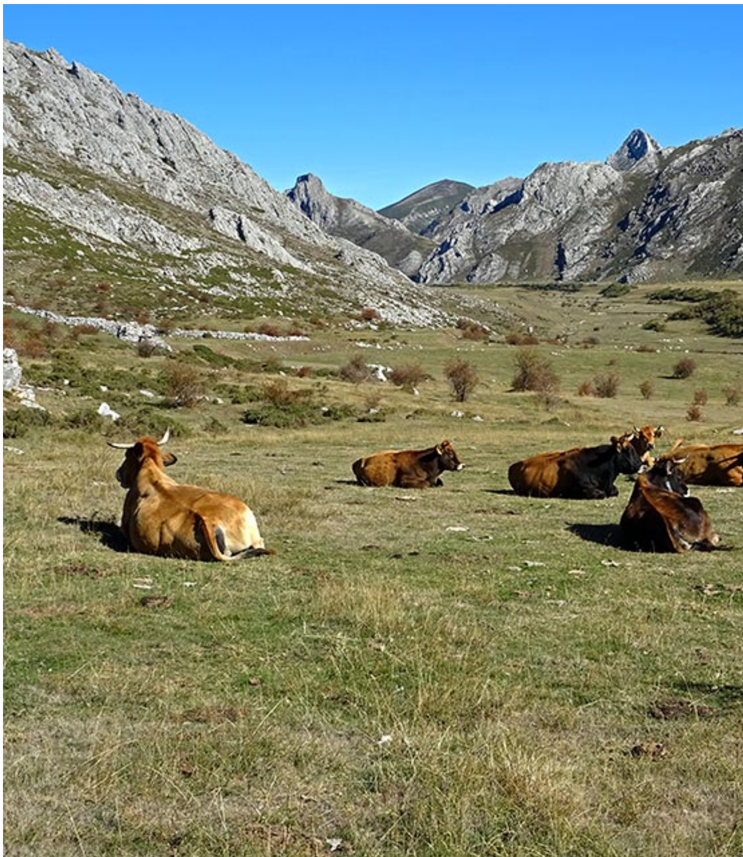
Vega del Panazal