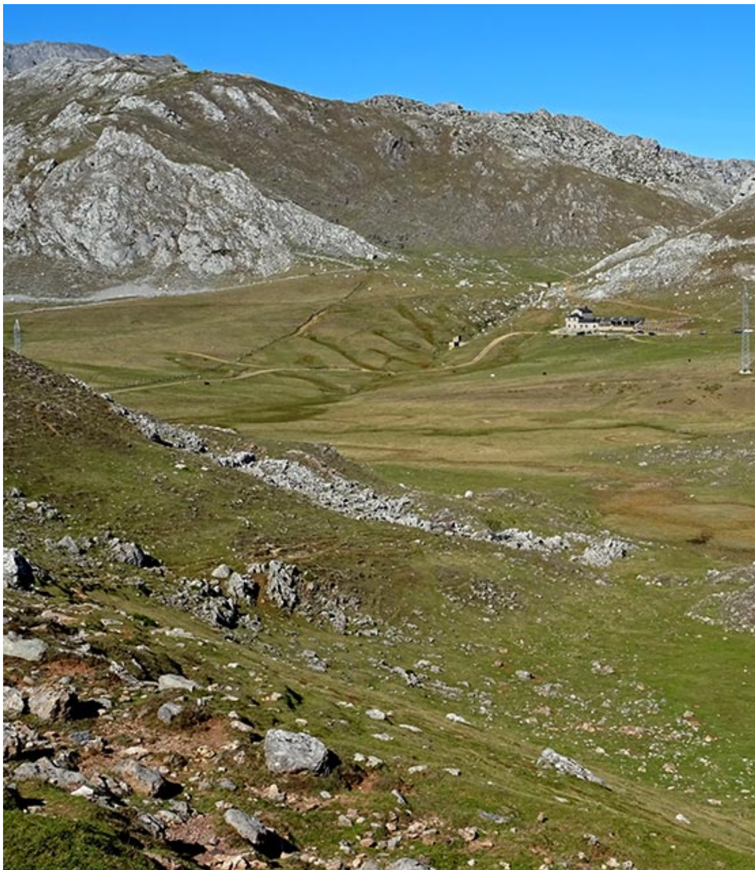
Pastizales y Casa Mieres al fondo