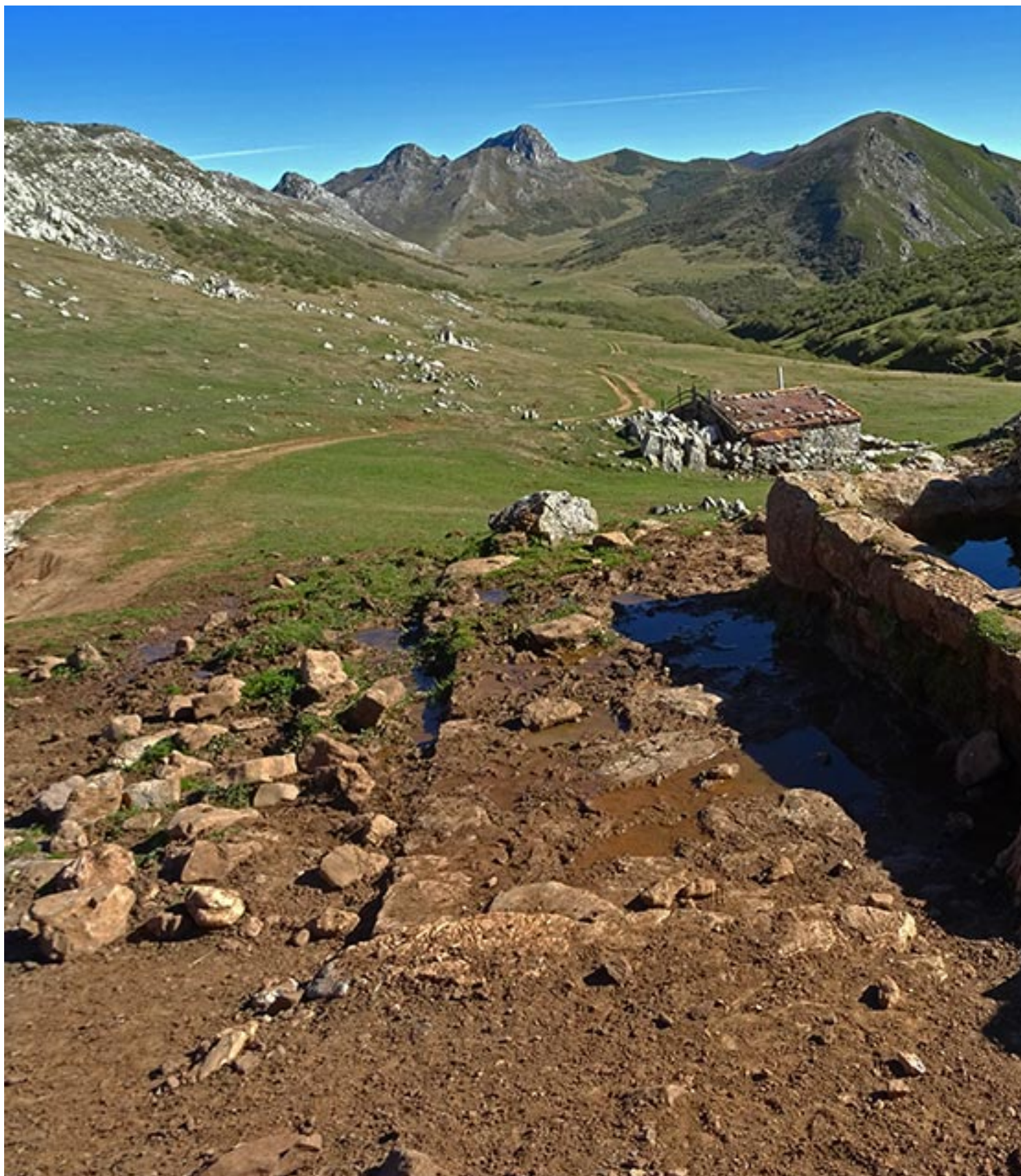
Fuente del Colladín de Piedra Sogera