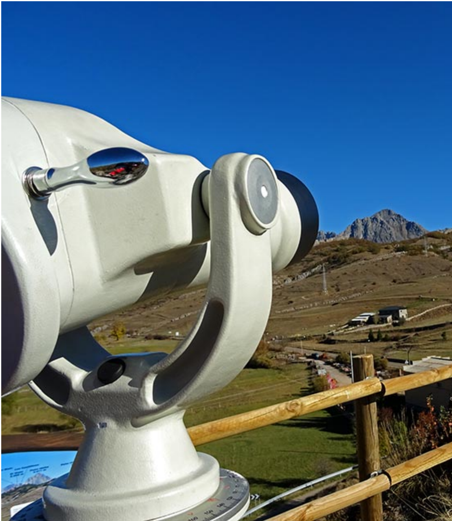
Mirador al macizo de Pañubiña