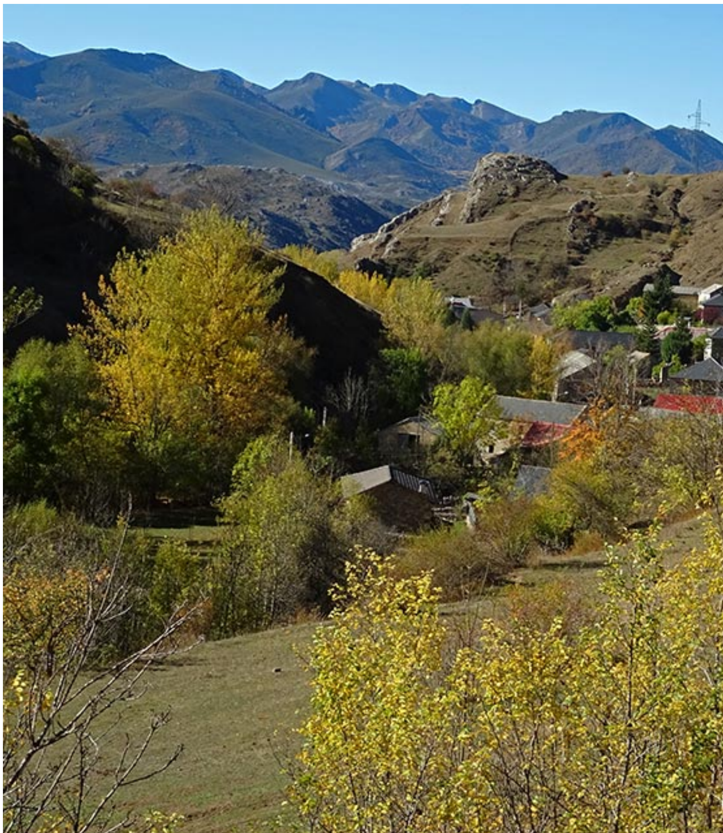
Aldea de Pinos