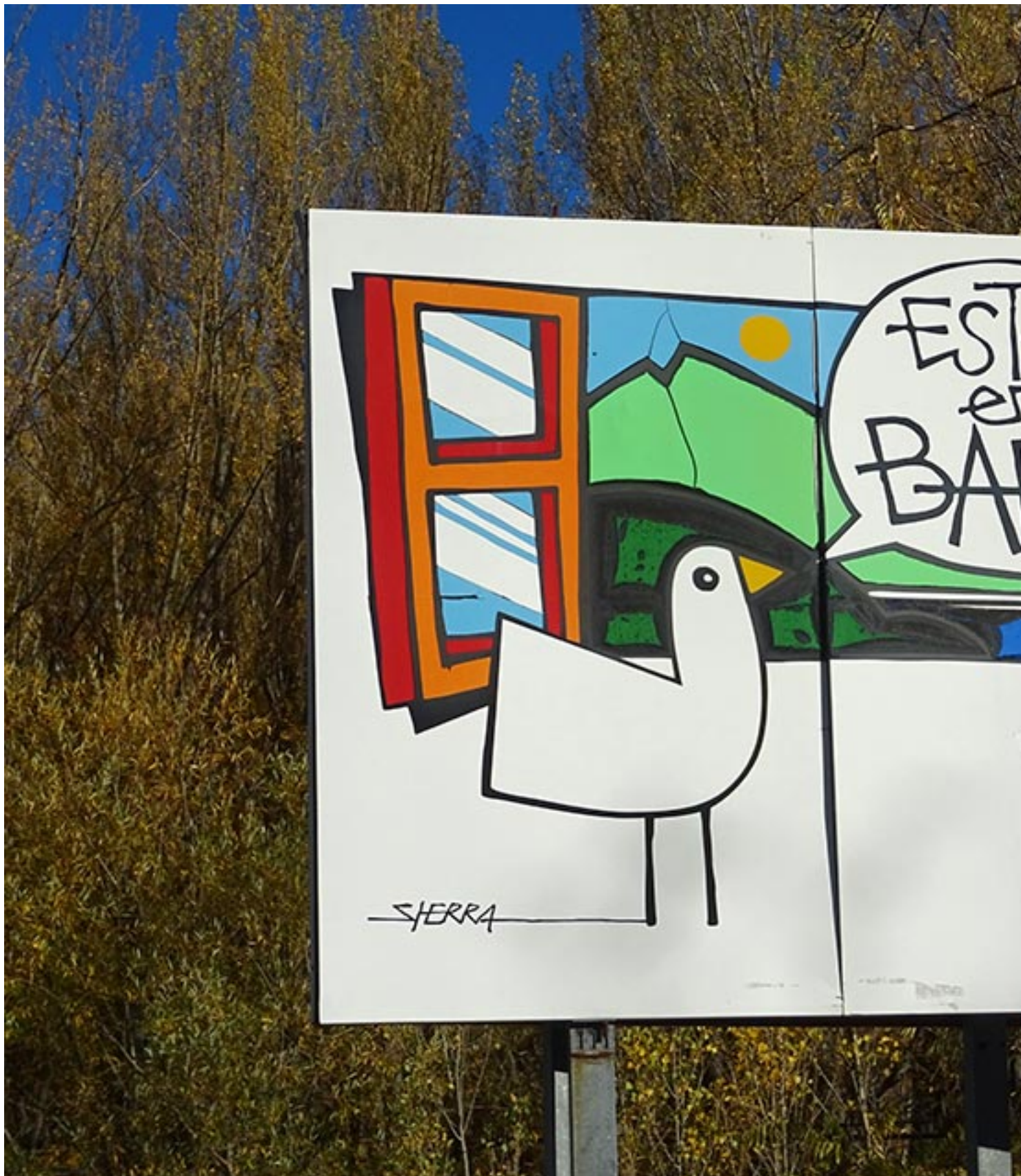
Asturies ConBici está en Babia