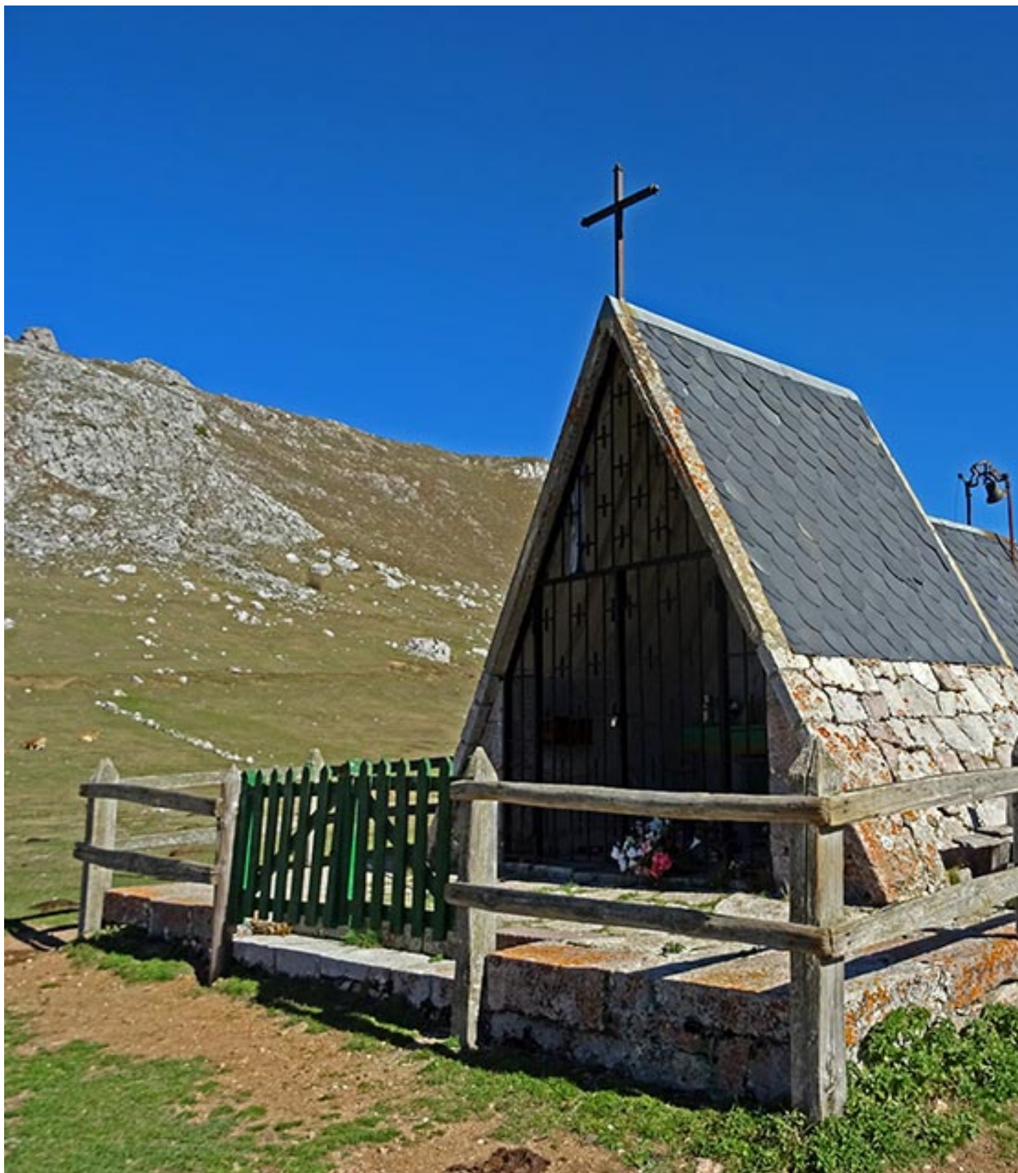
Capilla de Casa Mieres