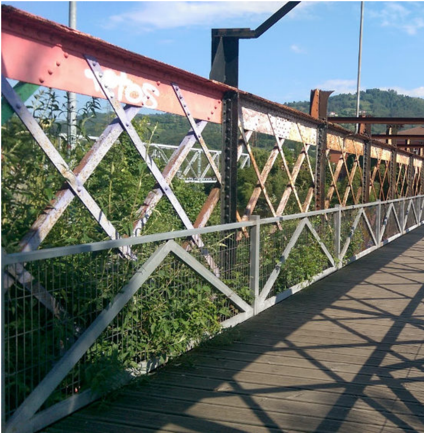
Puente en Sama