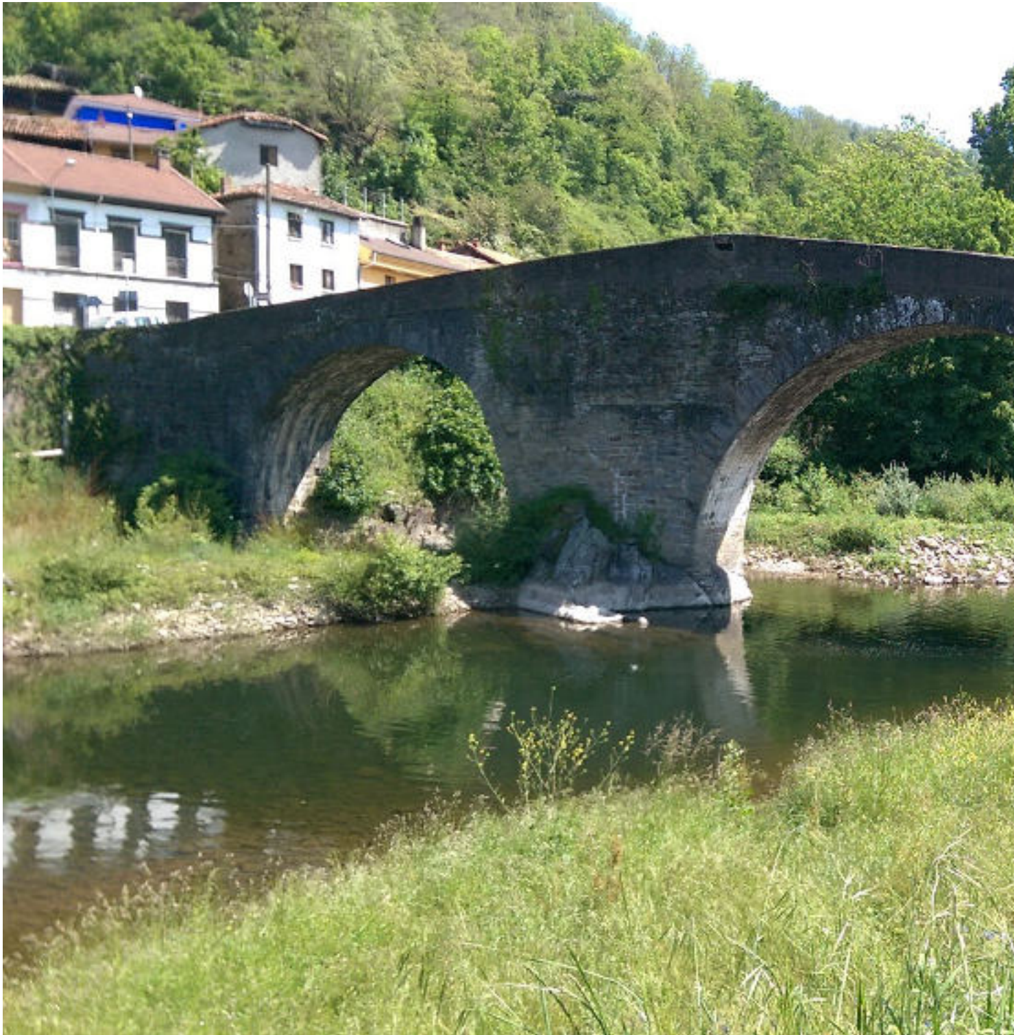
Puente de Arcu

Publicado por Cicloturismo - 16 Jun 2018 18:08