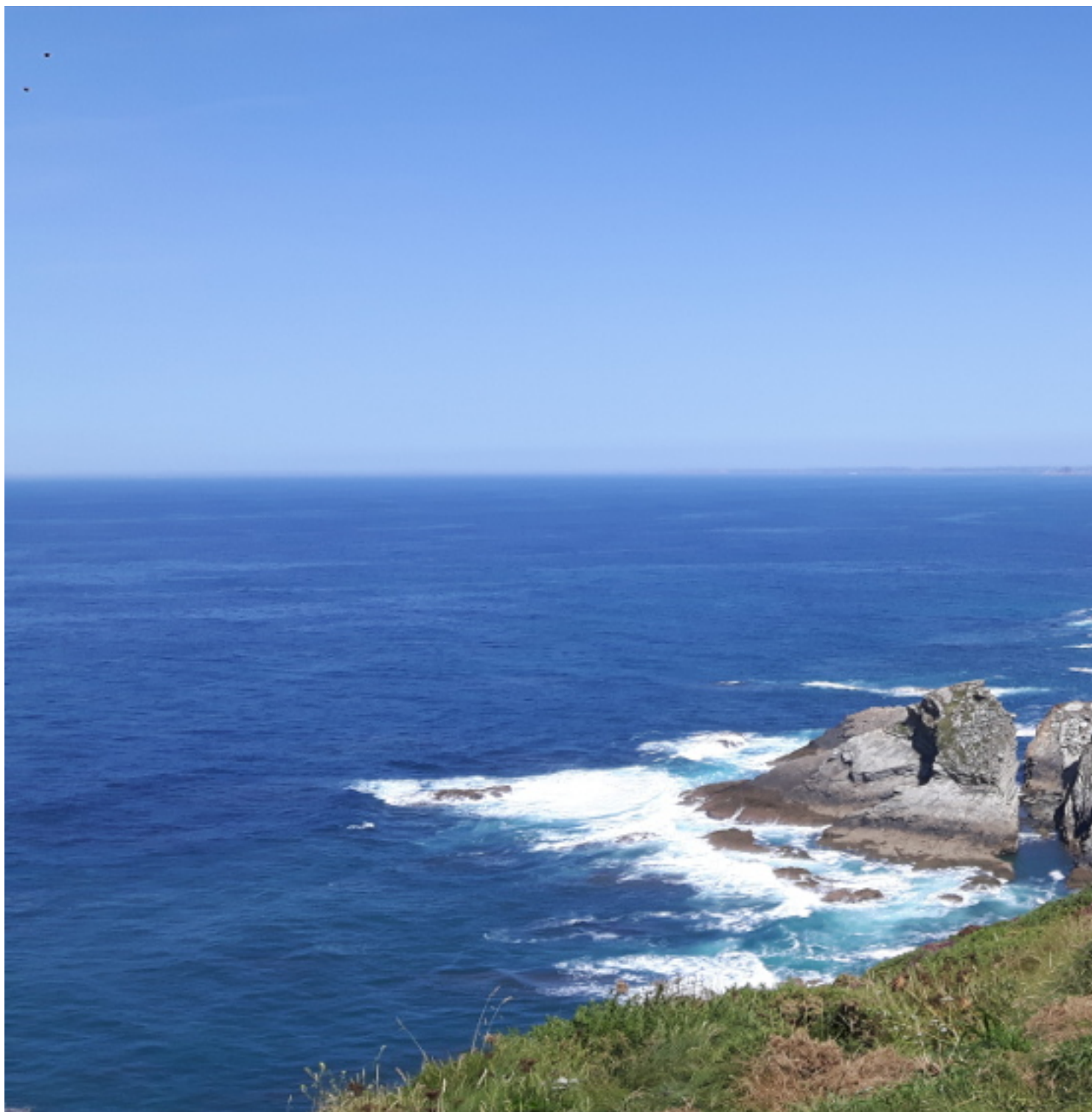
Costa desde el Cabo Vidio