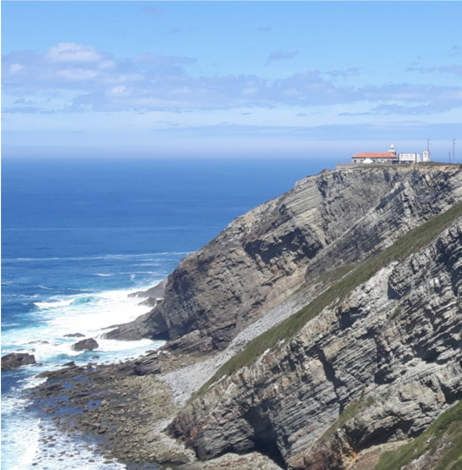
Faro del Cabo Vidio