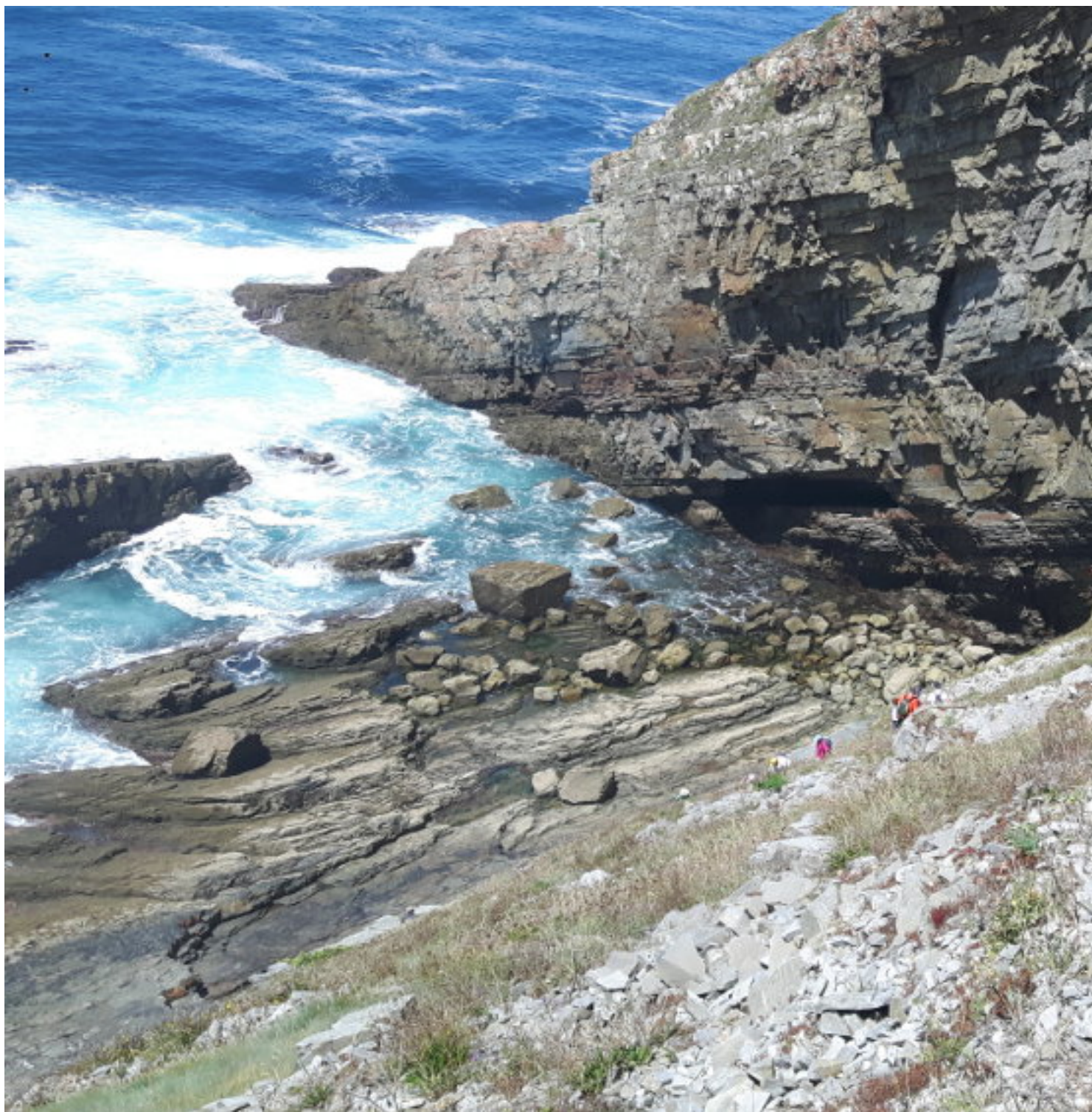
Bajada a la gruta