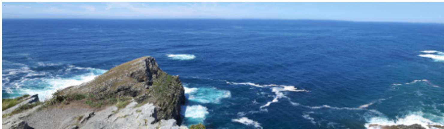
Vista desde el Cabo Vidio

Si las condiciones y el tiempo lo permite, los/las más intrépidos tomaremos el camino que baja hasta el mar desde el faro para, una vez abajo, entrar en la gruta a través de un estrecho paso que requiere llevar calzado adecuado para poder mojarlo. Allí se puede admirar esta maravilla de la naturaleza que desde arriba ni se sospecha de su existencia. Permaneceremos un tiempo prudencial dentro de la cueva para volver a retomar el camino de subida hasta el faro.