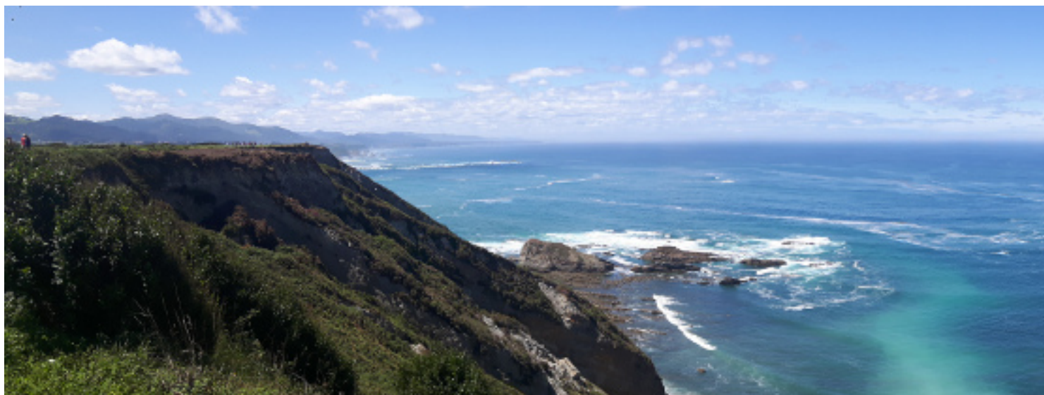
3 / 14

Salimos de Ballota y al poco nos adentramos siguiendo el Camino de Santiago en dirección contraria, en un pequeño bosque que nos va a llevar a Santa Marina . Una vez allí nos acercaremos hasta el borde del mar en un mirador desde donde tendremos una primera panorámica de la costa. De vuelta, tomamos la N-632 y en Castañeras tomamos un desvío, otra vez hacia el acantilado para acercarnos al borde del mar y contemplar la Playa del Silencio