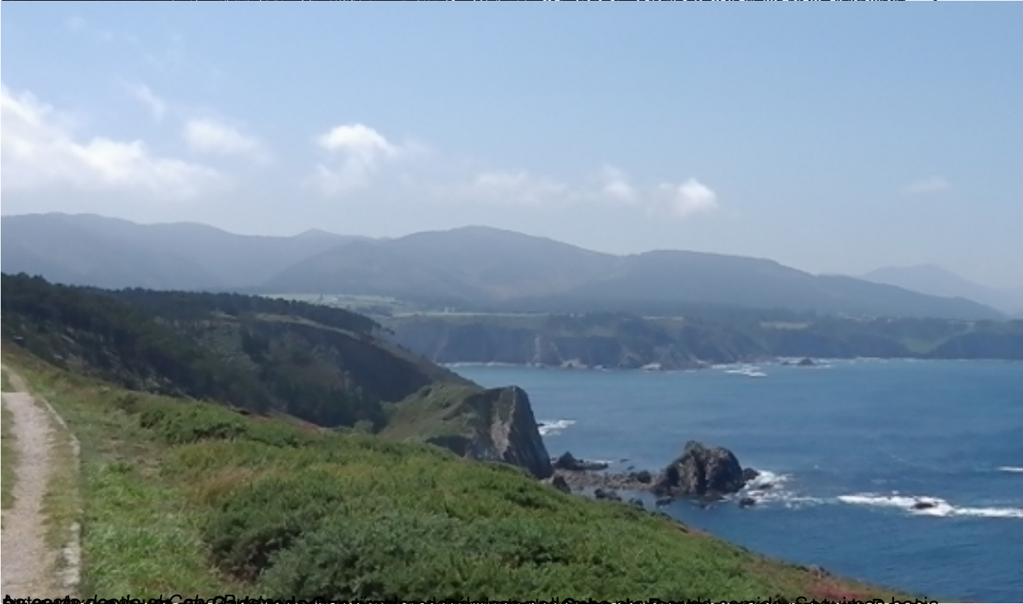
El mar desde el Cabo de Peñas, en Asturias. El mar azul y las montañas verdes en el fondo.