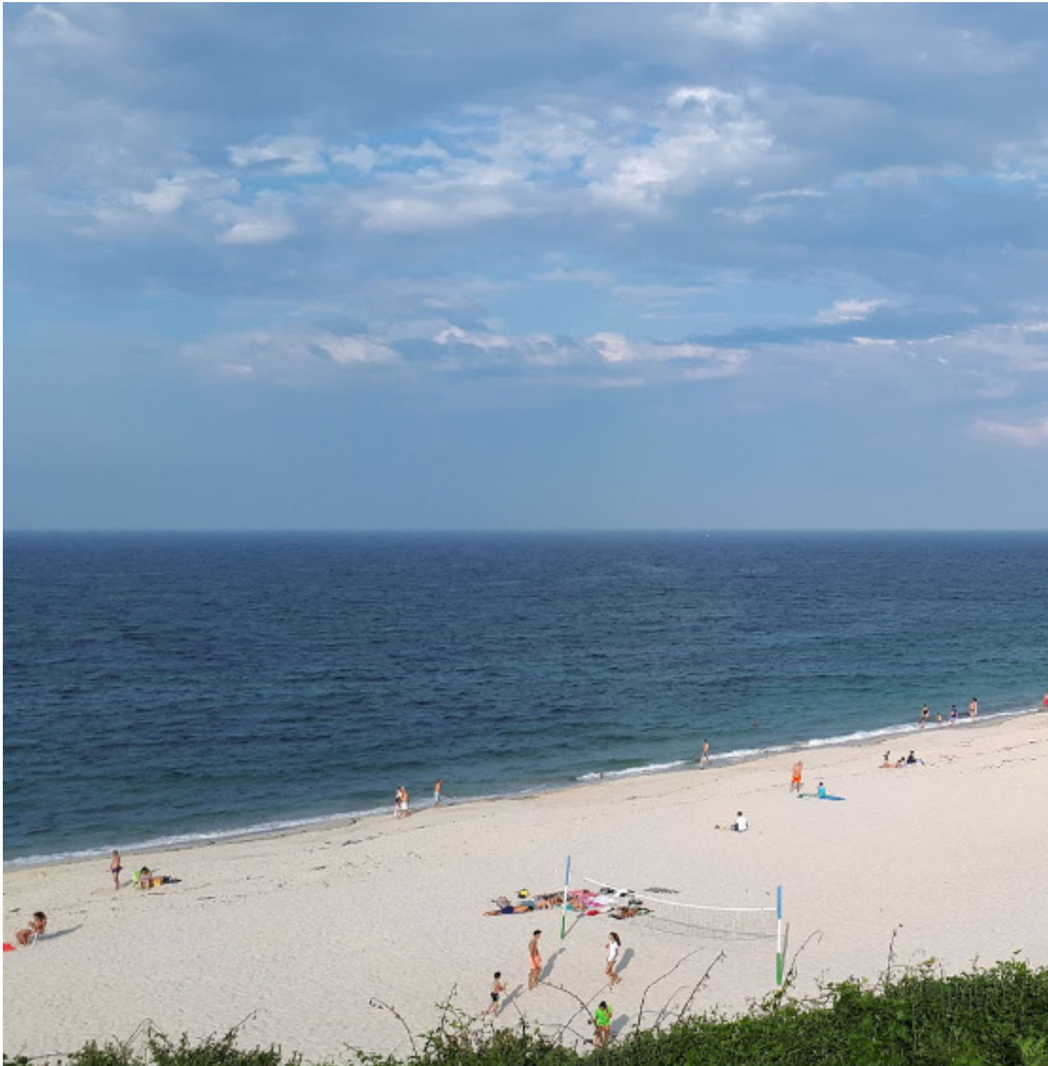
Playa de Llas