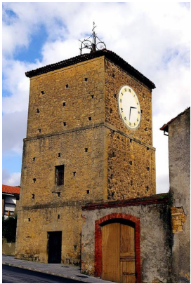
Torre del reloj de Noreña

Entraremos en Noreña, por la zona de la Torre del reloj , pasando por delante de la Casa-Palacio del Rebollín . Si disfrutan de la ruta en sábado, nuestro caso, habrá mercado donde se puede comprar algo para comer en el parque, una amplia zona verde donde poder comer un bocadillo, o quien desee comer en un bar, en Noreña no le faltan sitios.