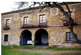
Casa-Palacio de El Rebollín