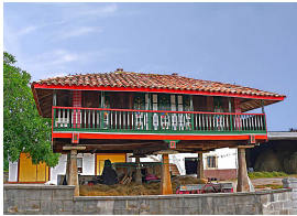
Panera en Cenero

¡Quien venga, tendrá que besar al gochín en el morrín!