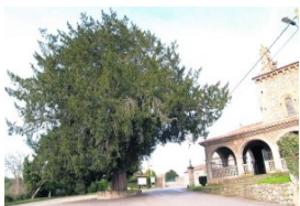
e San Juan Bautista en Cenero