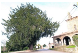
e San Juan Bautista en Cenero