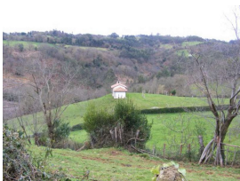
Solitaria Ermita de San Ananías (Huergo)