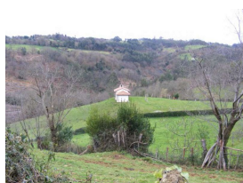
Solitaria Ermita de San Ananías (Huergo)