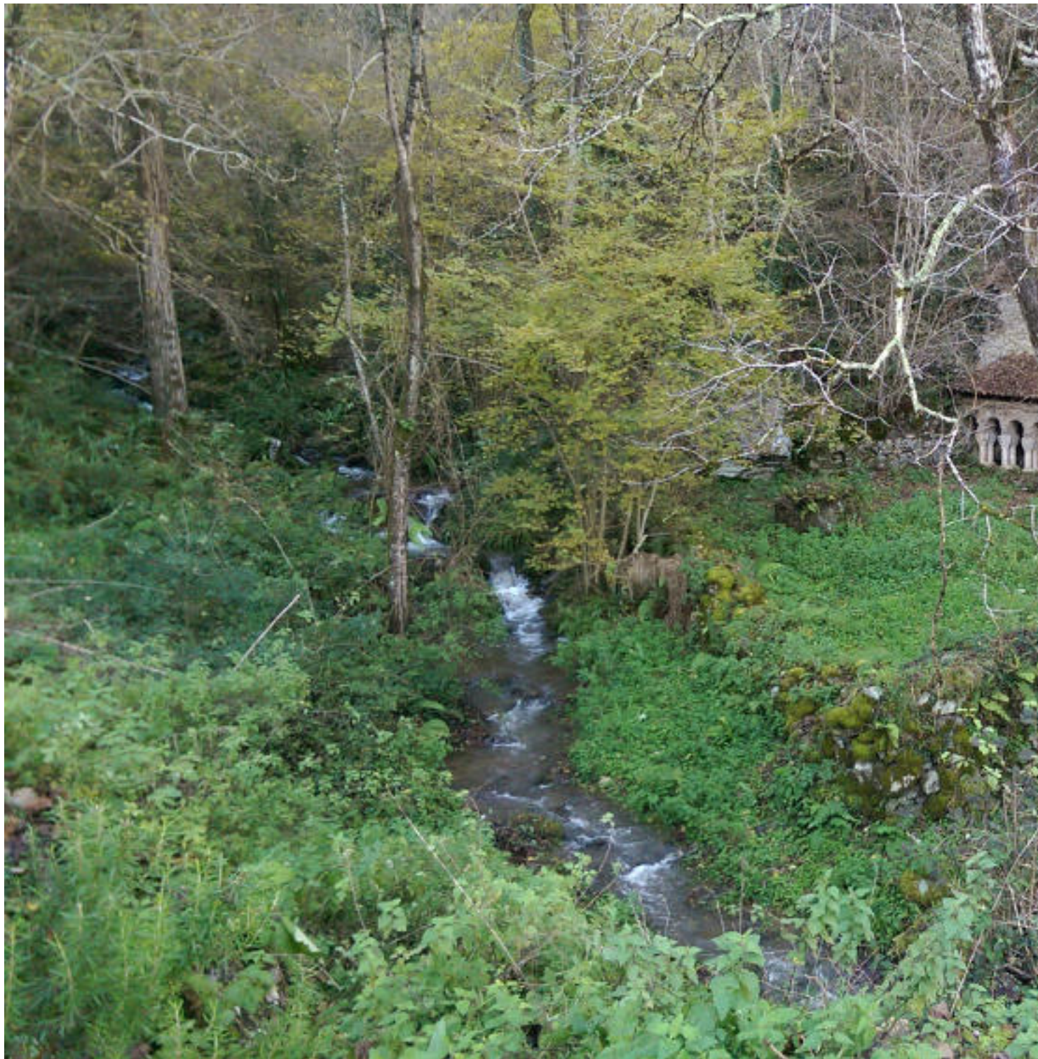
"Abadía-ermita" de Sabadía

Publicado por Cicloturismo - 14 Abr 2018 20:15