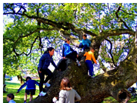
Juventud trepando por los hayedos del Tragamón

(Navelgas, Tineo, 1943), fue un encargo del Ministerio de Fomento para su instalación en la rotonda de La Guía. La forman dos piezas, distanciadas unos metros: una familia —papá, mamá y el niño con su bicicleta— apoyada en la barandilla, de espaldas a la ciudad; y unos metros detrás, el tronco de un árbol hueco.