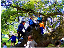
Juventud trepando por los árboles del Tragamón

(Navelgas, Tineo, 1943), fue un encargo del Ministerio de Fomento para su instalación en la rotonda de La Guía. La forman dos piezas, distanciadas unos metros: una familia —papá, mamá y el niño con su bicicleta— apoyada en la barandilla, de espaldas a la ciudad; y unos metros detrás, el tronco de un árbol hueco.