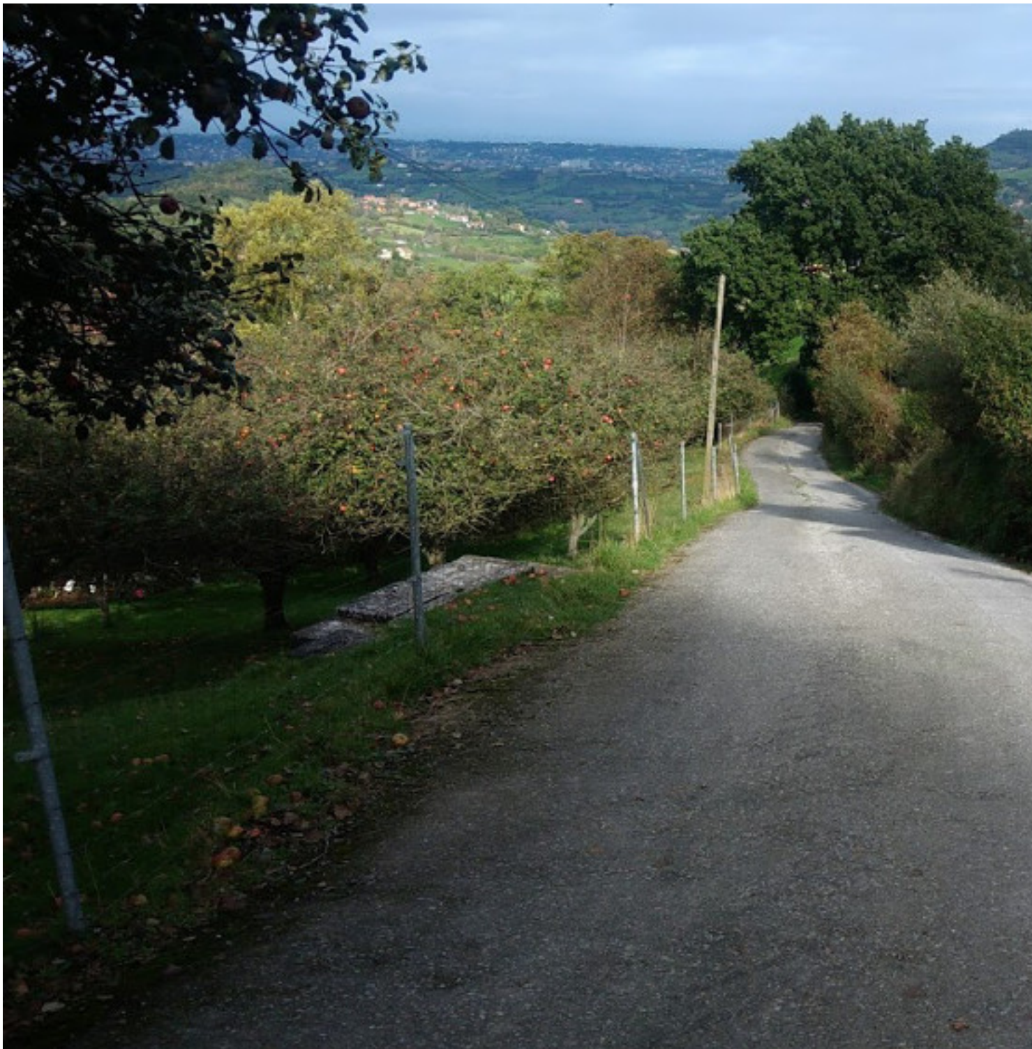
Bajando del Picu del Sol

Publicado por Cicloturismo - 04 Mar 2018 17:00