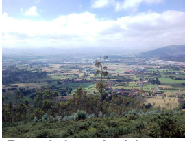
Dominios de Llanera desde el Picu Santu Firme

Publicado por Cicloturismo - 25 Feb 2018 07:59