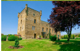
Torre de Valdés, San Cucao