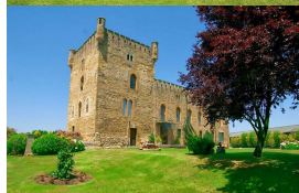
Torre de Valdés, San Cucao