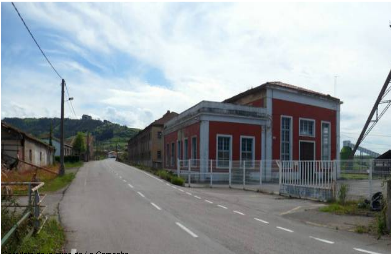
Castillete de la mina de La Camocha