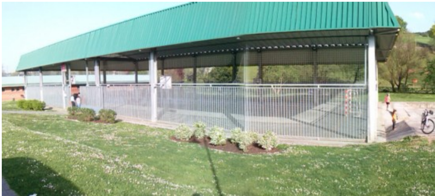
Polideportivo de La Camocha

Así que déjense cautivar por las aguas del arroyo Piles y Llantones y de la fuentes La Pinganilla , o de parajes sin igual como el de la Aliseda Pantanosa que les llevaremos a ver.