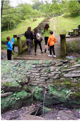
En la fuente de La Pinganiella

Desde allí iniciaremos descenso hasta el pueblo, donde comeremos en una amplia zona verde con cancha de baloncesto, varios futbolines, mesas de pimpón, pista de monopatín....una gozada para disfrutar y divertirse al aire libre. En el mismo área recreativa hay un campo de fútbol con una pequeña cafetería donde hacen bocadillos, así que si no queréis complicaros, podéis adquirirlos allí mismo. También hay varios bares con terraza en el pueblo.